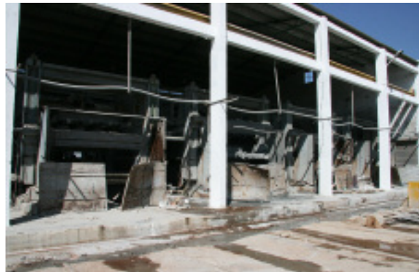
Ceeta verfügt über vier Granitgatter von Tema-Frugoli.