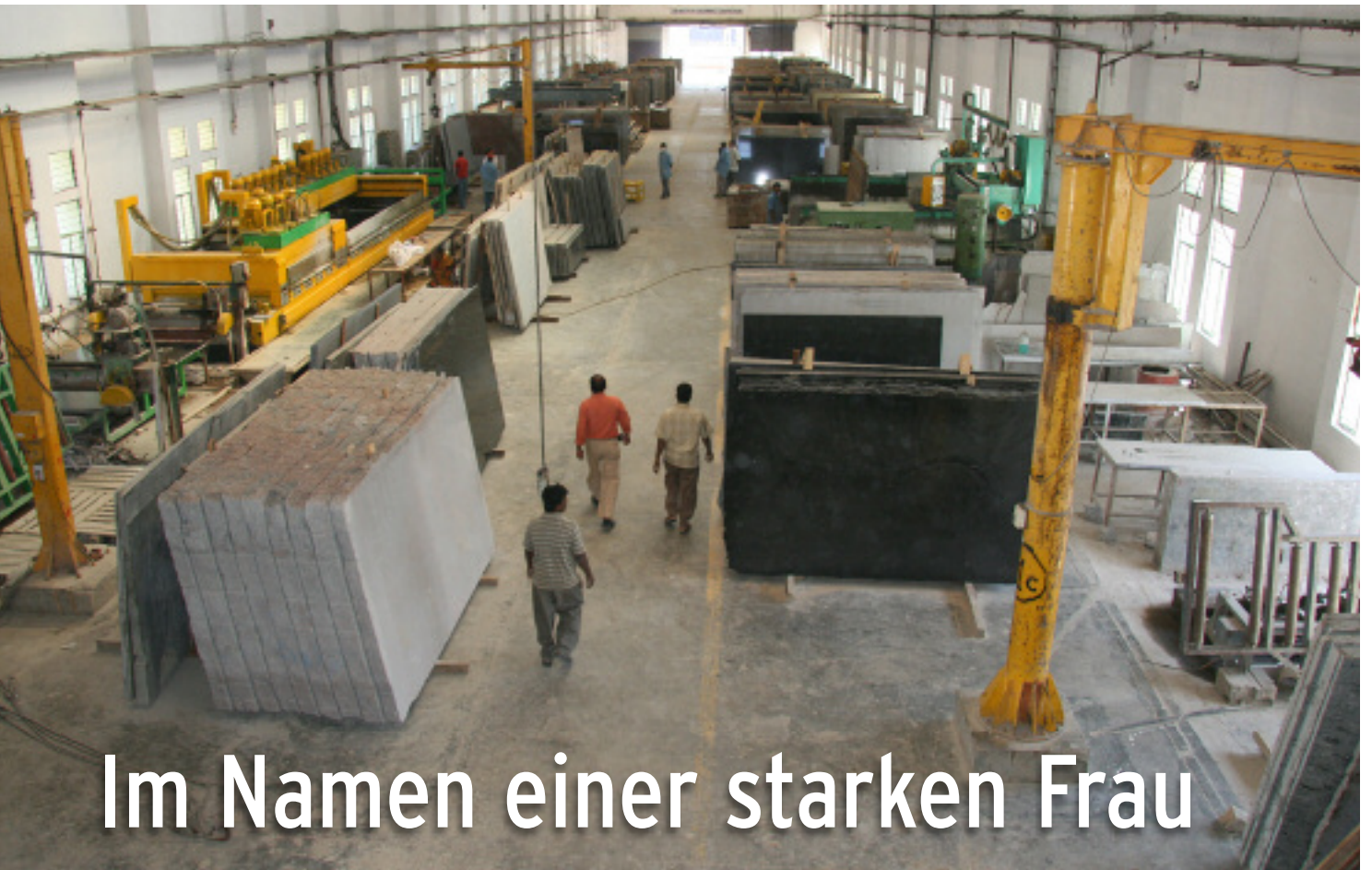
Unmaßplattenlager und Produktion in Tumkur bei Bangalore