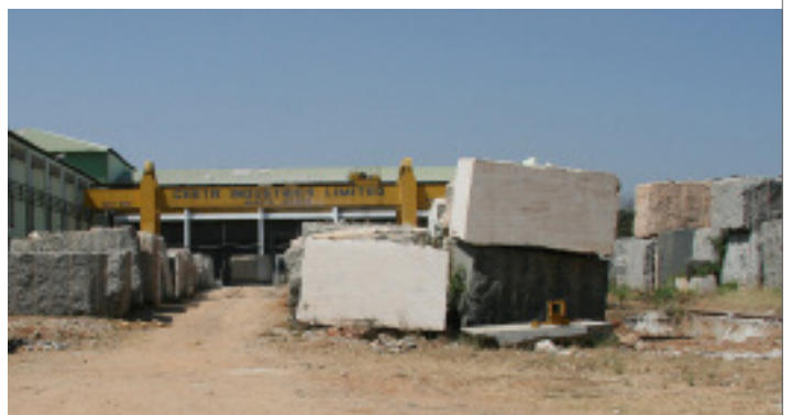
Blocklager des Unternehmens in Tumkur, 70 km von Bangalore