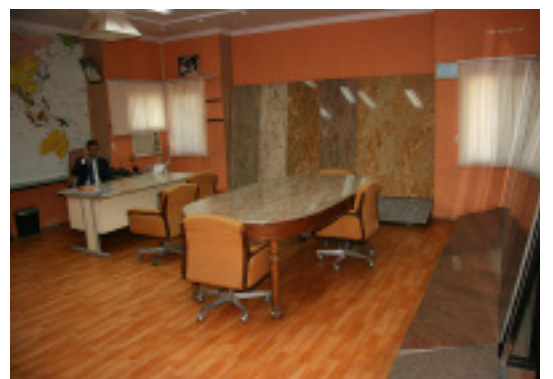
Für eigene Steine wirbt das Büro des Geschäftsführers.